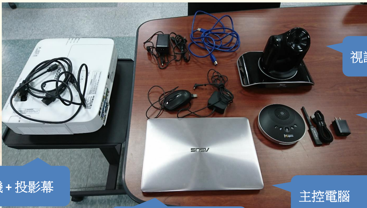
投影機 + 投影幕